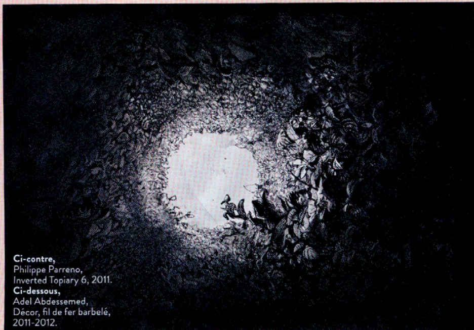
Ci-contre, Philippe Parreno, Inverted Topiary 6, 2011. Ci-dessous, Adel Abdessemed, Décor, fil de fer barbelé, 2011-2012.

L'artiste français Philippe Parreno se voit honoré cet été par la Fondation Beyeler. La vidéo Continuously Habitable Zones (CHZ) , qui constitue le cœur de l'exposition, mêle "science et fiction", nous dit-on. C'est qu'elle reprend les grandes thématiques de son œuvre et les interrogations que l'artiste soulève, à savoir : comment construit-on un récit ? Comment raconte-t-on une histoire ? Jouant de l'ambiguïté entre la fiction et la réalité, cette dernière vidéo a été tournée dans un paysage